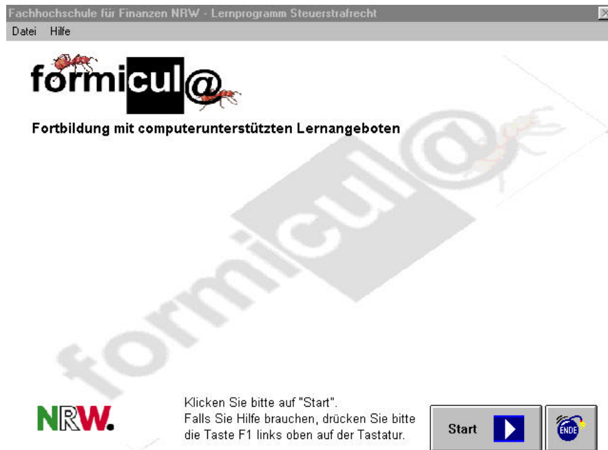
Bildschirm zu Beginn des Programms

Es ist einfach zu bedienen und kann von jedem Beschäftigten gehandhabt werden, der selbst nur minimale Kenntnisse über einen Personalcomputer mitbringt. Neben einer kurzen Einführung in die Handhabung des Programms wird in Übersichten die Struktur des Programms erläutert, die einzelnen Segmente vermitteln mit einem hohen Anteil an Interaktion die Lerninhalte, Lernzielkontrollen ermöglichen eine Erfolgskontrolle und im Hintergrund sind alle im Zusammenhang erforderlichen Gesetzestexte verfügbar.